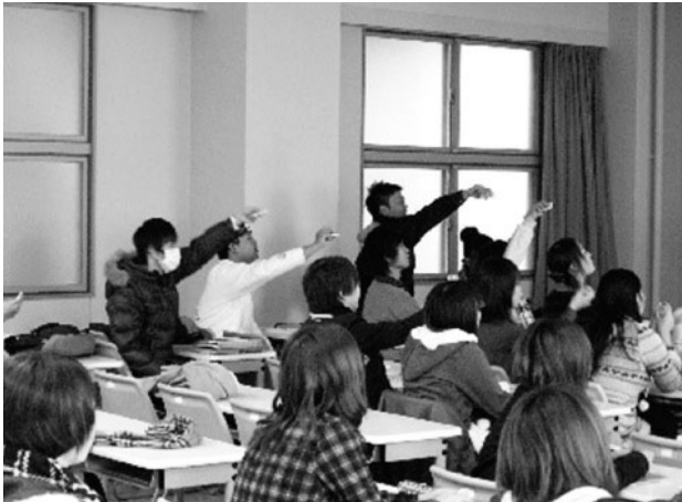
図2 クリッカー授業実践

ツールと位置付け、当初、参加者については本プロジェクト参加教職員に限っていたが、活性化を狙い、連携大学教職員全員に拡げて、現メンバーによる新規メンバーの招待制を取り入れた。同時に学生にも対象を拡げることについて議論を行なったが、当面は『京都地域の大学教職員』を対象を限定して運用することとなった。