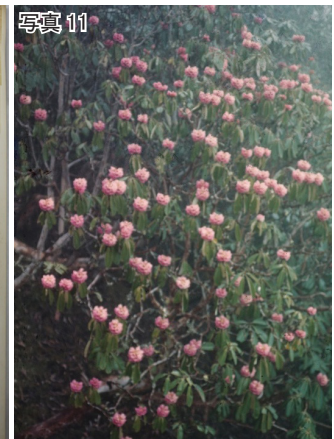
写真4：ユーマイ 1946年の日本での試験栽培品 写真5：ユーマイ（写真4の拡大）ハダカエンバク（2倍体）と誤認されてきたがユーマイは6倍体である。 写真6：エンバク（徳島県祖谷産） 写真7：ロードデンドロン・グリフィティアヌム「花は黄色、11 Apr. 1962. インド西ベンガル州ダージリンのシェルパ族の喫茶店で。葉は手で透かされ、花には象牙白色の黒点がある。」と英文でメモされている。 写真8・9：ロードデンドロン・トムソニー 花は深紅。 写真10・11：ロードデンドロン・ホジソニー 東ネパール グンサ付近のヤムテン氷河で。花はピンク。 *写真は、中尾佐助コレクションのスライドDB（写真1～3、9、11）と植物標本（写真4～8、10）を用いた。

とスライドと著作を読むと、当時の研究の様子がよくわかる。次に、中尾の探検に沿って、その一部を紹介する。