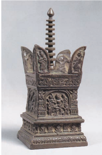
図1 奈良国立博物館『聖地 寧波』図33より