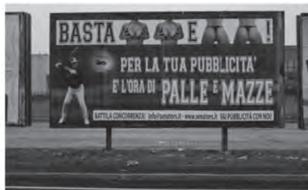
analisi e denuncia degli stereotipi di genere nella comunicazione www.lofficinadelledonne.it

しかしながら、このような用いられ方をするのは女性身体だけではありません。男性身体もまた、新たな欲望の対象として広告に登場しています。たとえばこの「バストもヒップももうたくさんだ。広告はボールとバットの時代だ」というキャプションが、男性身体の性化を謳っています（図7）。これこそ広告的ポルノグラフィと言えるでしょう。こちらはアルマーニの下着の広告です。モデルはベッカムです（図8）。ファッション関係ではトム・フォードの男性身体への女性による陵辱を暗示する広告もあります（図9）。