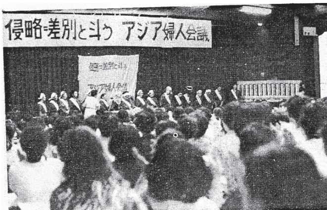
1970年8月22日 全体会（前に立つのは三里塚婦人行動隊） 写真2

22日、1日目の全体会は、実は私も参加しています。法政大学の大きな階段教室だったと思うのですが、後ろの方は白ヘルメットをかぶった一団がいて、何か言うたびに、「異議なし」「ナンセンス」と一斉に叫ぶんです。私は60年安保世代で、そういう学生運動文化を全然浴びていなかったの、なんでこんなところで異議なしと言うのだとすごく違和感がありました。