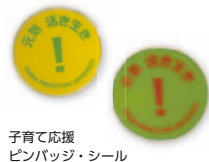
子育て応援 ピンバッジ・シール