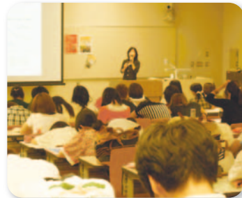
ロールモデル・セミナー

研究を続けていく上での色々な悩みを、先輩の研究者に相談できる仕組みを作っています。