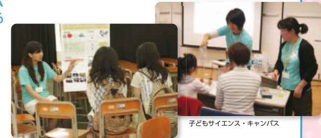
子どもサイエンス・キャンパス